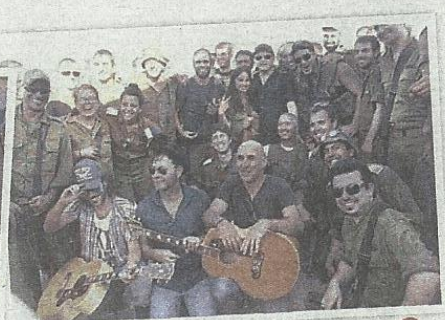
מתנתם פינוק לחיילים